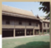
สถาปนิก Le Corbusier

นำแปลกใจที่แนวคิดที่คล้ายกันนี้เกิดขึ้นในโลกฝั่งตะวันตก ประมาณกลางศตวรรษที่ 20 Le Corbusier สถาปนิกผู้มีชื่อเสียงชาวสวิส ผู้ให้คำปรึกษาของบ้านว่าเป็น "Machine for Living" เป็นแนวคิดที่มองว่าการออกแบบบ้านต้องเริ่มที่ประโยชน์ใช้สอย บางส่วนของแนวคิดกลายเป็นรากฐานของ "International Style" หรือรูปแบบสากลของงานสถาปัตยกรรมท่ามกลางระบอบเผด็จการหลายที่มีบางอย่างที่ยังดูคล้ายๆ รายละเอียดของเรือนไทย อย่างเช่น ตัวอาคารที่ยกพื้นสูงมีได้ดูมโถง ให้อากาศถ่ายเท การจัดวางพื้นที่แบบอิสระและสวนบนหลังคาที่จำเป็นที่สังสรรค์เหมือนลานเรือนของบ้านไทย